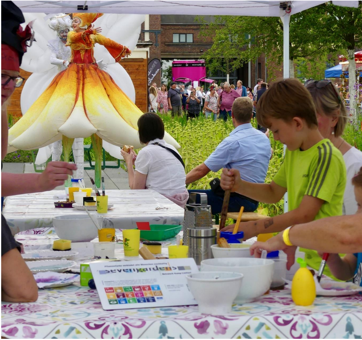
„Sevengardens Kamp-Lintfort“ bei der „Extraschicht – Nacht der Industriekultur“ im Zechenpark

Ausstellung „Tinte, Feder und Papier“ in der Mediathek Kamp-Lintfort https://heute-schon-gelesen.de/2023/09/28/neue-ausstellung-tinte-feder-papier/