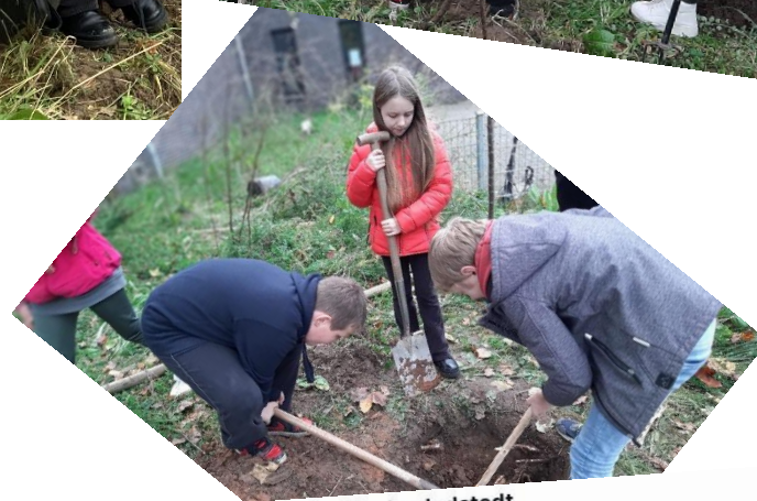
Natur- und Klimaschutz in der Hochschulstadt