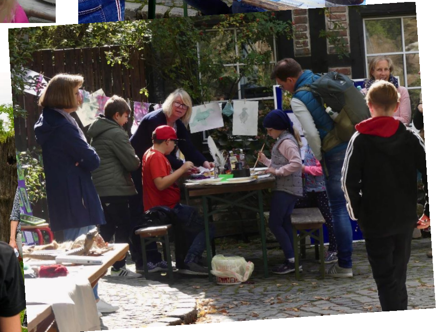
Teilnahme am RVR-Greenday 2023